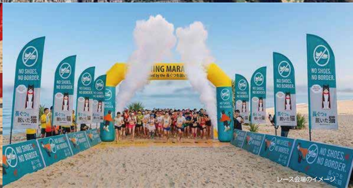
レース会場のイメージ